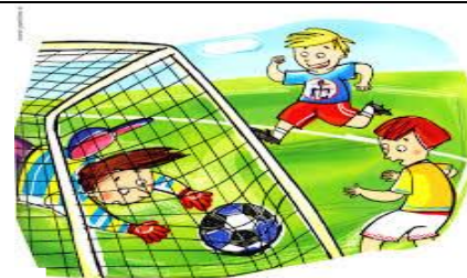
CALCIO A 5

★ CENTRO SPORTIVO SCOLASTICO E' stato costituito per riorganizzare le attività fisico - sportive nella scuola secondaria di I grado. Esso intende avviare un' esperienza formativa essenziale al pieno sviluppo della personalità degli alunni. Le attività proposte dal C.S.S per l'anno scolastico 2015-2016 sono: